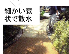
細かい霧状で散水

簡単な水の浸透程度の確認法! まさどうらく施工場所のすぐ脇地で、ペットボトルを切ったものに同じ厚みのまさどうらくを入れ、同じように散水し、水の浸透を確認下さい。