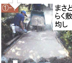
まさどうらく敷き均し