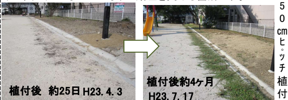
植付後 約25日 H23.4.3 植付後約4ヶ月 H23.7.17

植付適期 3月中旬~10月初旬。最適期は3~7月。日当たりがよく、水はけのいい場所に植付下さい。日蔭地や水はけの悪い場所は避ける。