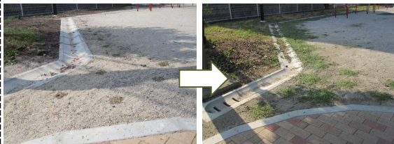
植付後 約25日 H23.4.3 植付後 約4ヶ月 H23.7.17 ↑公園の入口なのでかなりの踏圧を受ける箇所です。